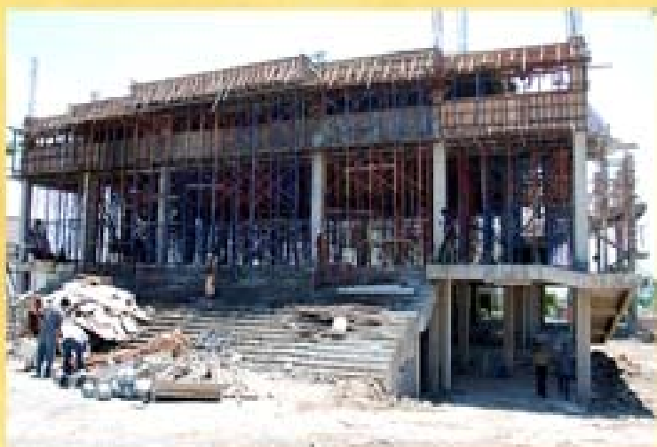
Foto Struktur 1

Pembangunan dimulai Pebruari 2011 berfokus pada Pondasi dan Struktur.